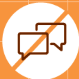
Parler avec son voisin