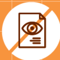
Copier sur son voisin