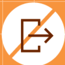
Sortir durant la première heure de l'épreuve